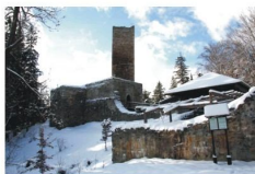
Zřícenina hradu v zimě

CASTRUM o.p.s. Správa hradu Orlík nad Humpolcem Hradská 818, 396 01 Humpolec tel.: +420 607 461 131 e-mail: info@hrad-orlik.cz kastelan@hrad-orlik.cz www.hrad-orlik.cz