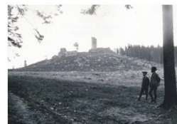
Zřícenina hradu kolem roku 1911

CASTRUM o.p.s. Správa hradu Orlík nad Humpolcem Hradská 818, 396 01 Humpolec tel.: +420 607 461 131 e-mail: info@hrad-orlik.cz kastelan@hrad-orlik.cz www.hrad-orlik.cz