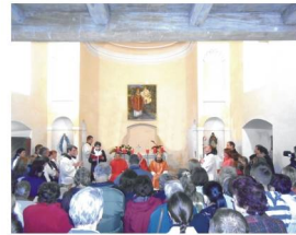
Nové vysvěcení kaple 4. 5. 2014