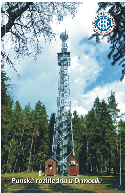
Panská rozhledna u Drmoulu