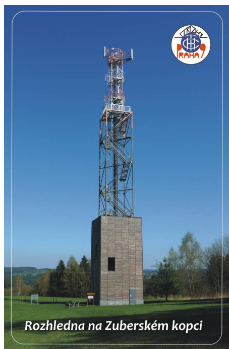
Rozhledna na Zuberském kopci