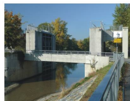
ústí říčky Rokytky do Vltavy

Kontakt: e-mail: sberatelskakarta@seznam.cz www.sberatelskakarta.cz