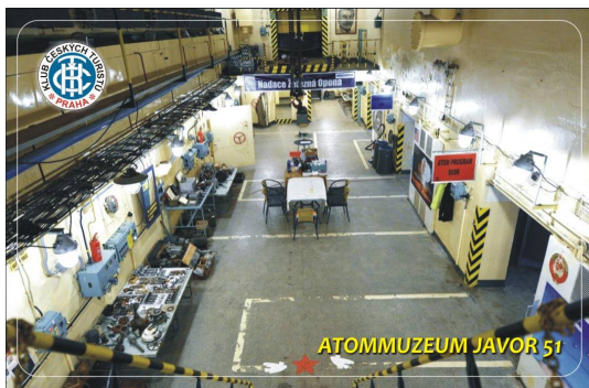
ATOMMUZEUM JAVOR 51

Starší verze karet: karta č. 1389 ještě v prodeji