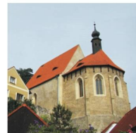
kostel Nejsvětější trojice

Více informací získáte na www.hrad-rabi.eu